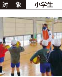
パートナー 山口ペイトリオッツ

■集合 俵田翁記念体育館 ■時間 ①未経験者 10:15～11:00 ②経験者 11:15～12:00 ■料金 無料 ■定員 各20名 【用意】室内用シューズ