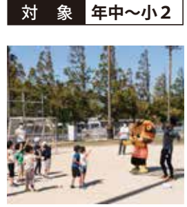
パートナー 株式会社レノファ山口、レノファ山口スポーツクラブ

■集合 ユーピーアールスタジアム グラウンド 外野 (左野エリア) ■時間 ①年中・年長 13:15～14:00 ②小1・小2 14:15～15:15 ■料金 無料 ■定員 ①20名 ②30名 ※要保護者同伴