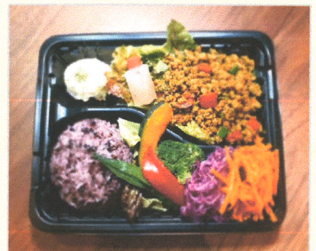
TOFU-MEAT100% 手作りガパオライス弁当