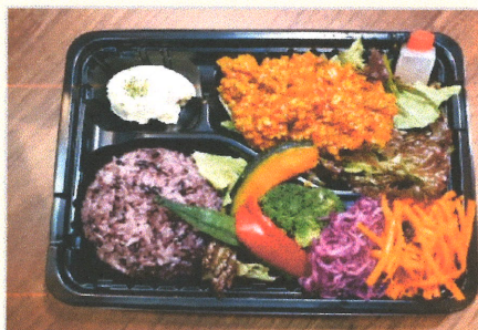
TOFU-MEAT100% 手作りキーマカレー弁当

○BOSS TY CAFEとTANITA CAFEのコラボランチメニューをお弁当に詰めました！