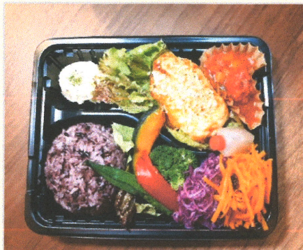
揚げない手作り チーズチキンカツ弁当