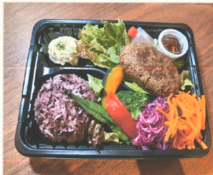
TOFU-MEAT100% 手作りハンバーグ弁当